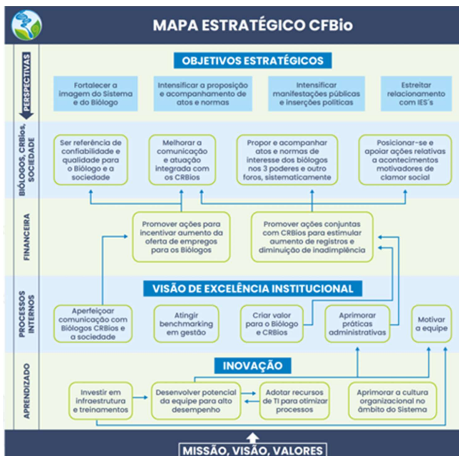
Figura 3: Mapa Estratégico do CFBio

Todos os Direcionadores Estratégicos são materializados no Mapa Estratégico do CFBio (Figura 3)