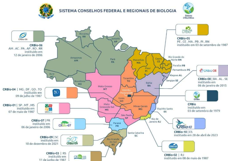
Figura 2: Mapa com as regiões atendidas pelos CRBios

Com o desenvolvimento de seu conhecimento, o Biólogo passou a adquirir uma formação especializada, abrindo ainda mais os caminhos para sua atuação profissional em diversos campos, com grande espectro de opções para atuação no mercado de trabalho.