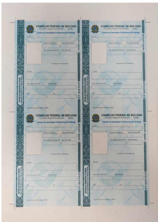
Disposição por folha A4