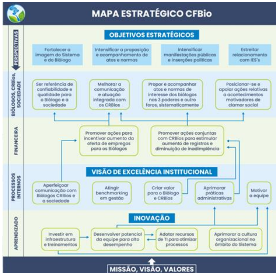
Figura 3: Mapa Estratégico do CFBio

Todos os Direcionadores Estratégicos são materializados no Mapa Estratégico do CFBio (Figura 3)