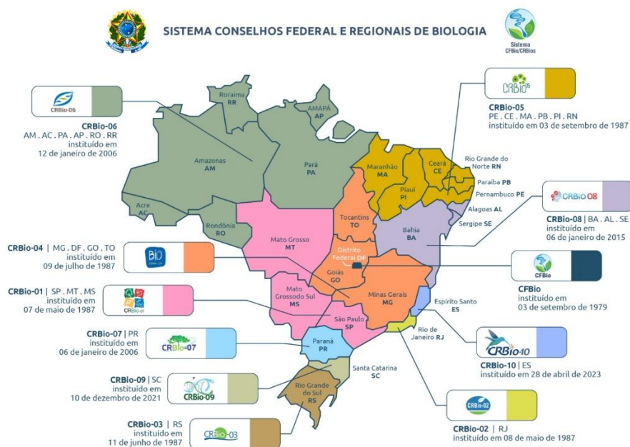
Figura 2: Mapa com as regiões atendidas pelos CRBios

Com o desenvolvimento de seu conhecimento, o Biólogo passou a adquirir uma formação especializada, abrindo ainda mais os caminhos para sua atuação profissional em diversos campos, com grande espectro de opções para atuação no mercado de trabalho. De acordo a Resolução N° 700, de 20 de abril de 2024, que dispõe sobre a regulamentação das Áreas do Conhecimento, das Atividades Profissionais e das Áreas de Atuação do Biólogo, ficaram estabelecidas as áreas de Meio Ambiente e Biodiversidade, Saúde, Biotecnologia e Produção Industrial e Educação, para efeito do exercício profissional.